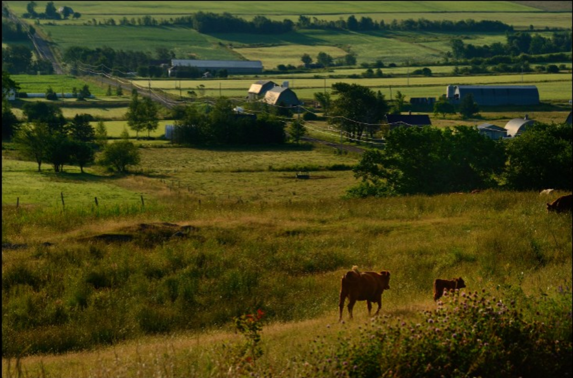
Souvenirs d'enfance et nouvelle ruralité...