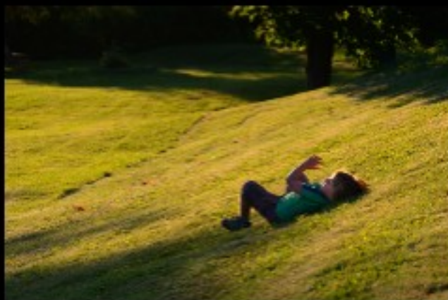
La vallée du bonheur...