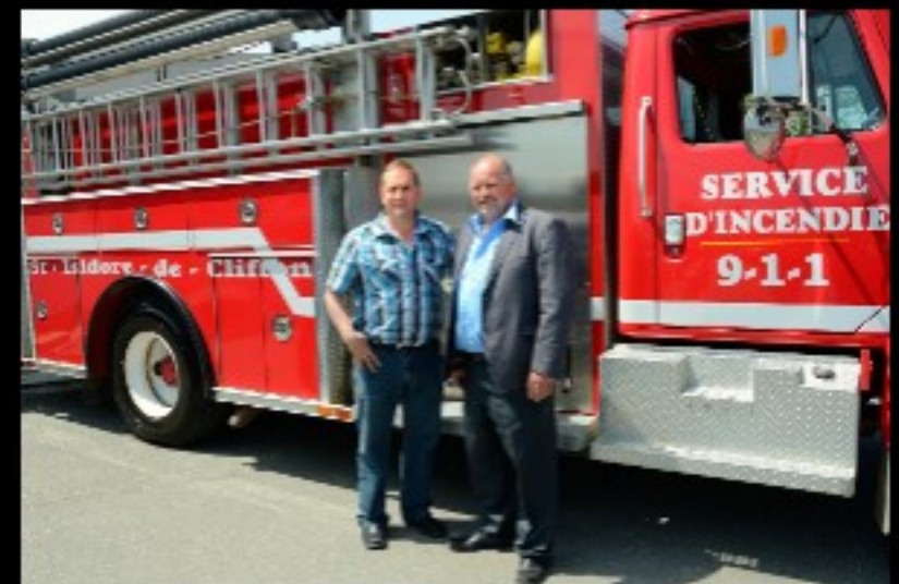
La formation de la relève... Et la collaboration avec les municipalités avoisinantes.