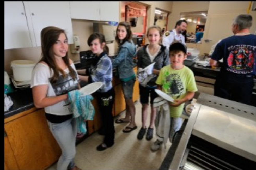
La maison des jeunes...