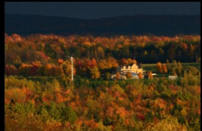
Le plus grand orme de l'Estrie à la Ferme Thomas, symbole du développement durable à Saint-Isidore-de-Clifton.