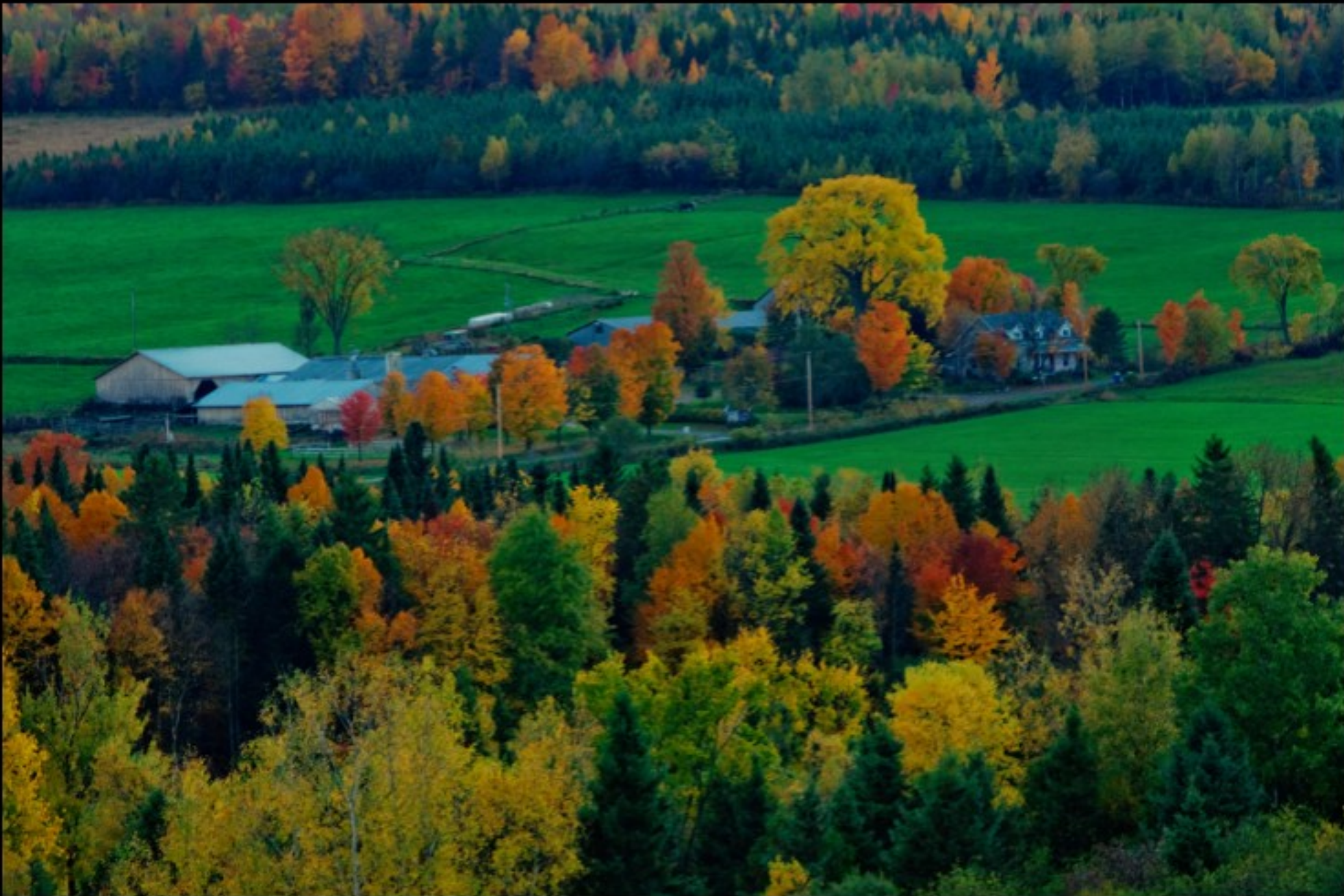
La Ferme Thomas et le plus grand orme de l'Estrie.