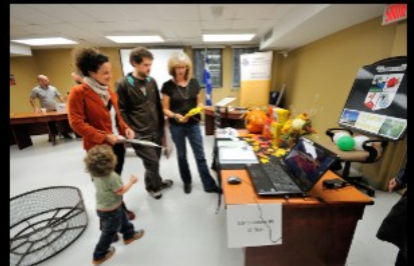
Participation aux Portes ouvertes du Haut-Saint-François, à un circuit artistique et accueil de Place aux jeunes.