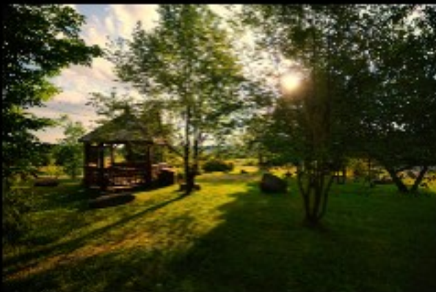
La halte routière sur la route 253.